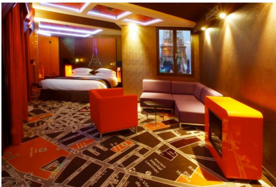
Suite de l'hôtel Sublim Eiffel

Même concept urbain au Sublim Eiffel qui met en avant Paris et ses spécificités urbaines ! Métro oblige ; l'atmosphériste et l'architecte entendent faire entrer la ville dans les chambres : néons flashy au bar, pavés et bouches d'égout dans les moquettes, fibres optiques fluo dans les salles de bain, tables de nuit aux allures de cabines téléphoniques, plans des 15 et 7 ème arrondissements de Paris au sol ; la ville jette ses innombrables lumières dans les moindres recoins des 19 chambres.