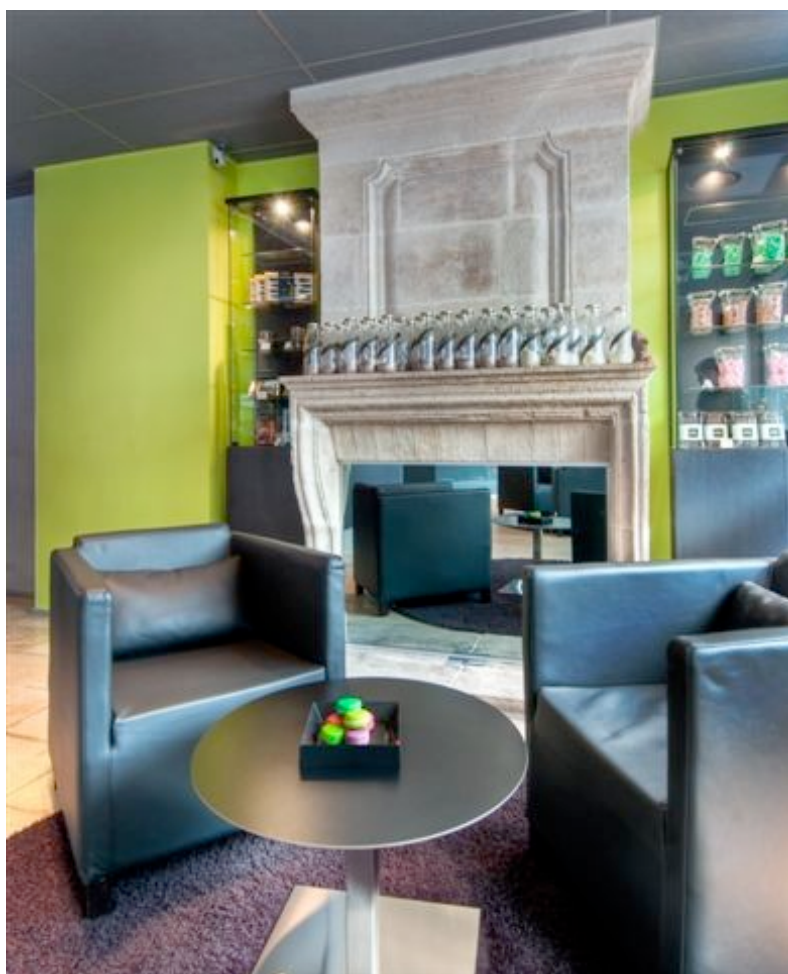
Bar à chocolat du Cadran Hôtel

Dans le quartier très commerçant de la rue Cler (7 ème arrondissement), le Cadran Hôtel affiche un concept zen et contemporain qui a pris le temps pour thématique. Partout de séduisantes pendules, des cadrans lumineux marquant les heures attendent, dans des lignes épurées et dans un camaïeu de gris et vert pomme, les seniors globe-trotters qui, pour leurs affaires, ont besoin de connaître l'heure